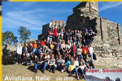
Koper, Slovenië (Venetië, Italië) okt 2018