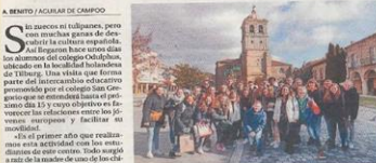
Los chicos ya han visitado las ruinas más impresionantes de Aguilar. J. Navarro

Un grupo de veintiseis alumnos procedentes de Tilburg llegó el miércoles a la villa gallega para descubrir la cultura española