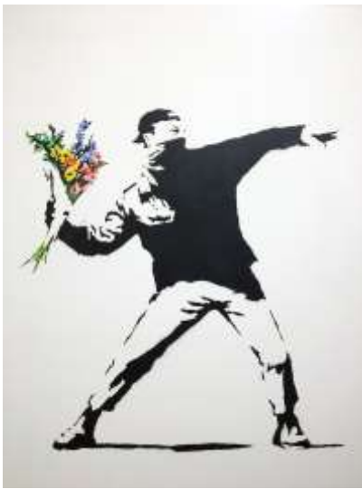
Graffiti artist: Banksy

Programma Projectweek Brugklas Maandag 7 tot en met vrijdag 11 oktober 2019